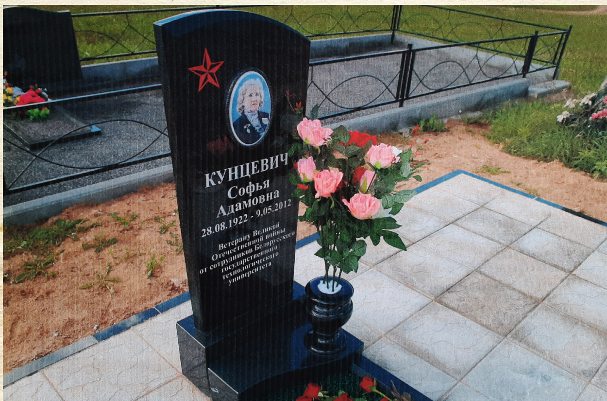
Памятник на кладбище Радошковичи