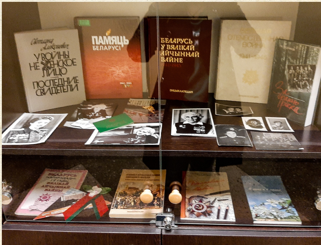
Выставка библиотеки «Была война...Была Победа...», фотографии ветеранов войны