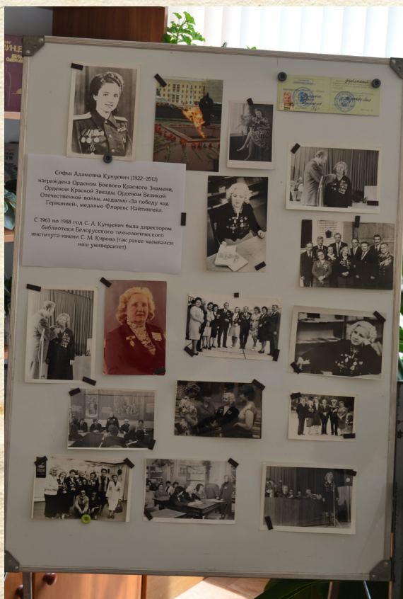
Стенд, приуроченный к республиканской акции-марафону «75 крокаў да вызвалення»